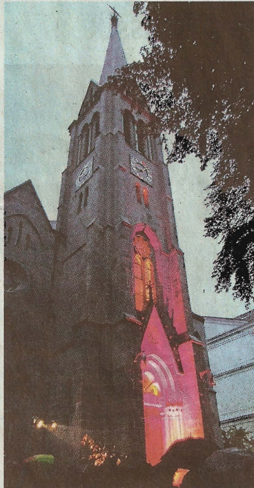
An der Immanuelkirche beginnt morgen Abend wieder die Vier-Türme-Aktion...