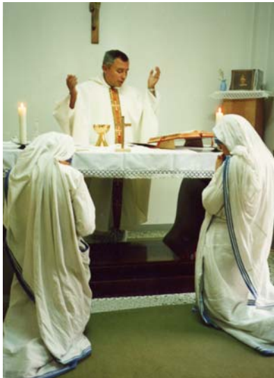
Unser Pfarrer feiert seit 1988 die hl. Messe mit den Schwestern in ihrer Kapelle

das Opfer, das Jesus am Kreuz darbrachte. Es ist sehr tröstlich, dass dieses Opfer auch unser Opfer ist... Die hl. Messe ist die geistige Nahrung, ohne die ich keine Stunde meines Lebens durchstehen könnte“ (Mutter Teresa).