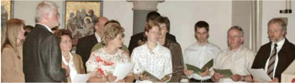
Mitglieder des Vesperkreises heute